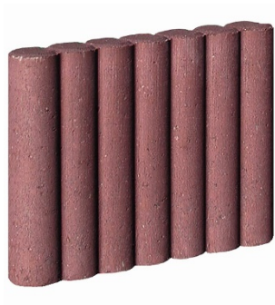
6 x 47 x 25 cm