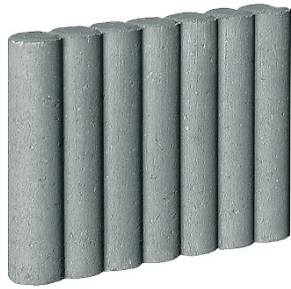
6 x 47 x 25 cm