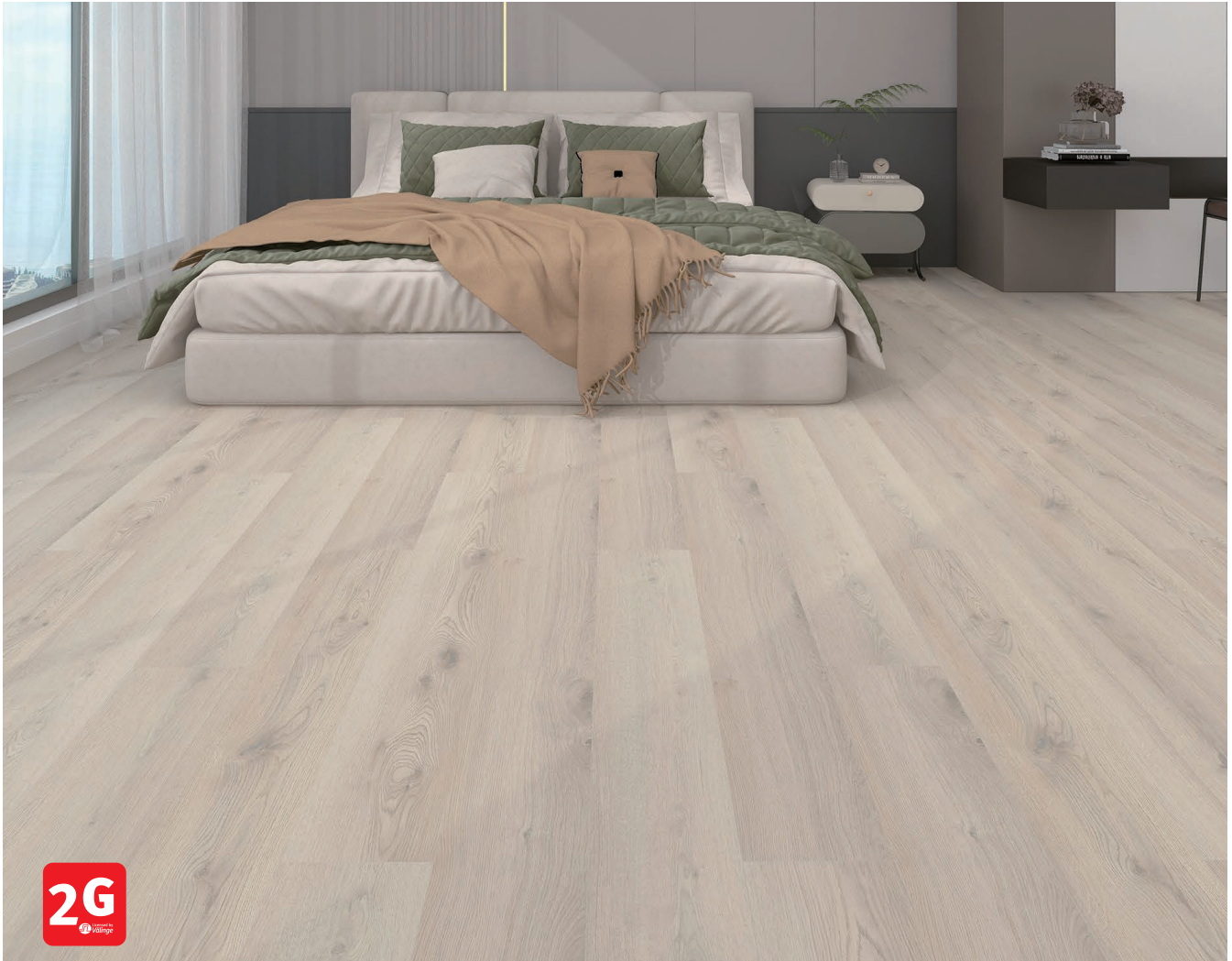
Sämtliche Abbildungen können farblich vom Originalprodukt abweichen.